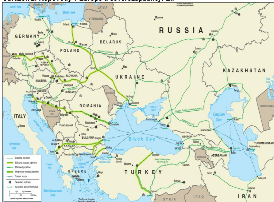
Obrázok 2: Ropovody v Európe a severozápadnej Ázii