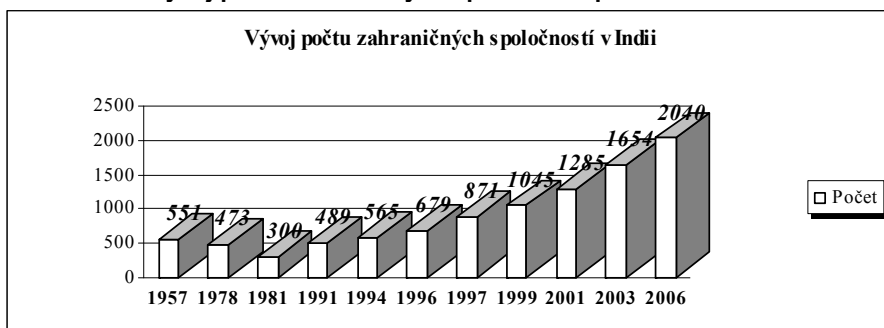
Obrázok 1 Vývoj počtu zahraničných spoločností pôsobiach v Indii