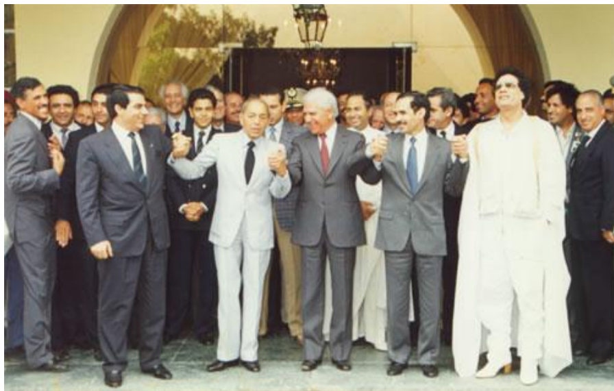
Obr. č. 1: Setkání hlav států Maghrebu v alžírské Zeraldě, 1988 (Maghrebarabe, 2011)

UMA spolupracuje také s ostatními mezinárodními organizacemi, například s EU nebo s UNESCO. Příklad jednání s EU je setkání 21.1. a 22.1.2008 v Rabatu, kdy se sešli slovinský ministr zahraničních věcí Dimitrij Rupel (v té době Slovinsko předsedalo EU) s ministry zahraničních věcí jednotlivých států Arabské maghrebské unie. (Eu2008: Participation of Minister..., 2008)