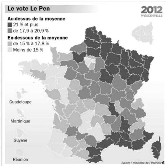
Mapa č. 1: Výsledky Marine Le Penové v prvom kole prezidentských volieb v roce 2012 podle departementů.

Legenda (odshora dolú, od najtmavší šedej po nejsvetlejší): výsledky vyšší než průměr: 21 % a více / 17,9 % - 20,9 %. Výsledky nižší než průměr : 15 % - 17,8 % / méně než 15 %